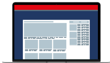
Position haute Habillage Bannière haute