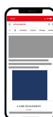
Position conversationnelle Format conversationnel