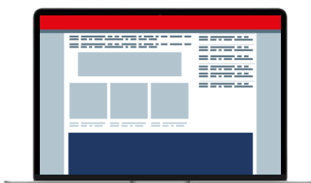
Position basse Floor Ad