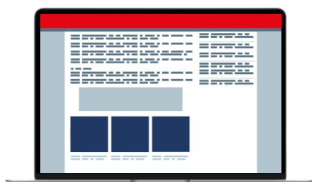
Position native Native Ad