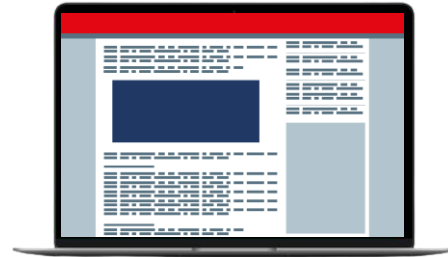
Position centre Vidéo out-stream / parallax / pavé