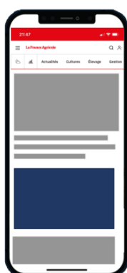
Position centre Pavé / Vidéo Outstream / Parallax