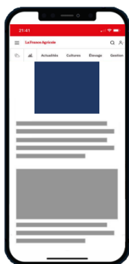
Position haute pavé