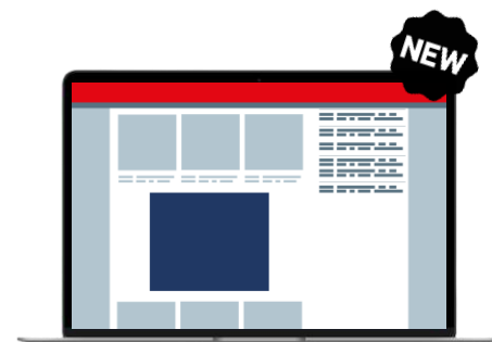
Position conversationnelle Format conversationnel