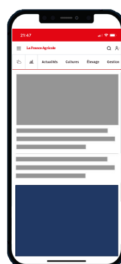
Position native Native Ad