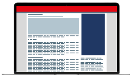
Position droite Grand angle Pavé rectangle